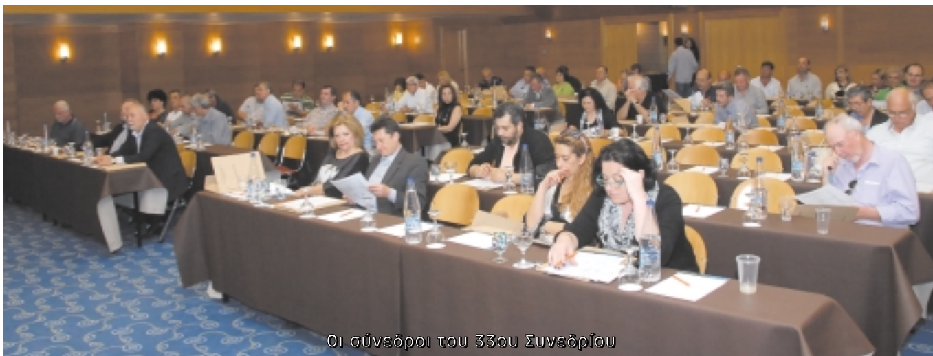
Οι σύνεδροι του 33ου Συνεδρίου

Ζητάμε την επανασύσταση του ΤΕΟ ως Ν.Π.Δ.Δ., διαφορετικά τη μεταφορά όλου του προσωπικού της καταργούμενης ΤΕΟ Α.Ε. στη ΓΓΥ με την ίδια εργασιακή σχέση που κατείχε πριν την κατάργησή του, που με αντισυνταγματικό τρόπο απολύθηκε ή τέθη-