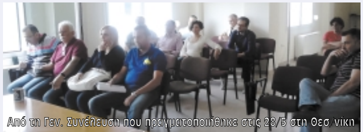
Από τη Γεν. Συνέλευση που πραγματοποιήθηκε στις 28/5 στη Θεσ. νίκη