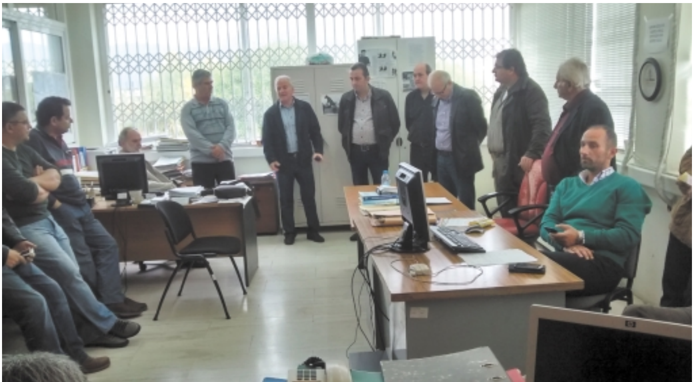
Από την επίσκεψη του ΔΣ της Π.Ο.Σ.Ε.Υ.ΠΕ.ΧΩ.Δ.Ε. στο Μεσολόγγι στις 12/11/2014