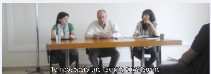
Το προεδρείο της Γενικής Συνέλευσης

Σημείωση: Η Εφορευτική Επιτροπή της Αθήνας θα αποτελέσει και την Κεντρική Εφορευτική Επιτροπή που θα εκδώσει το ΔΣ