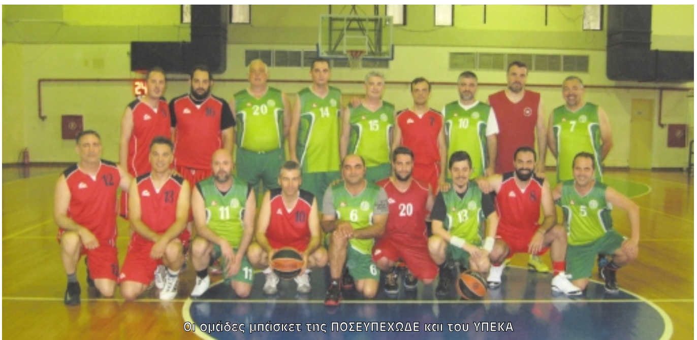
Οι ομάδες μπάσκετ της ΠΟΣΕΥΠΕΧΩΔΕ και του ΥΠΕΚΑ

Σε έναν κόσμο που αληθιά με μεγάλη ταχύτητα η Ελλάδα καλείται να αντιμετωπίσει τα διαρθρωτικά της προβλήματα και να ανταποκριθεί στις νέες μεγάλες προκλήσεις. Ο ρόλος του Συνδικαλιστικού Κινήματος στις νέες συνθήκες δεν είναι να αποδεχθεί και να υιοθετήσει τις κυβερνητικές προγραμματικές επιλογές, δεν είναι η σύμπληυση, η συμπόρευση με την κυβέρνηση και το πρόγραμμά της. Αντίθετα τα συνδικάτα πρέπει να διατυπώσουν τις δικές τους «προγραμματικές θέσεις», το δικό τους αγωνιστικό πλαίσιο στόχων, αιτημάτων, διεκδικήσεων. Η αποδυνάμωση των συνδικάτων το τελευταίο διάστημα είναι στοιχείο που