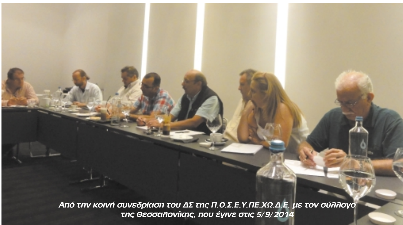
Από την κοινή συνεδρίαση του ΔΣ της Π.Ο.Σ.Ε.Υ.ΠΕ.ΧΩ.Δ.Ε. με τον σύλλογο της Θεσσαλονίκης, που έγινε στις 5/9/2014

• Στο πλαίσιο της κοινωνικής αλληλεγγύης, η οποία στη σημερινή συγκυρία καθίσταται πιο αναγκαία από ποτέ, ενισχύσαμε οικονομικά συναδέλφους για λόγους υγείας.