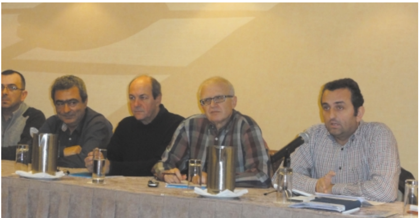
Από τη Συνέλευση των Προέδρων της Π.Ο.Σ.Ε.Υ.ΠΕ.ΧΩ.Δ.Ε. στις 11/12/2014

• Με επιστολή μας προς τους αρμόδιους Υπουργούς (37/20-3-2014), ζητήσαμε την επανένταξη τόσο των υπηρεσιών αποκατάστασης σεισμοπλήκτων, όσο και της αρμοδιότητας Συντήρησης Αυτοκινητοδρόμων Κεντρικής Μακεδονίας στη Γενική Γραμματεία Υποδομών μαζί με το έμπειρο