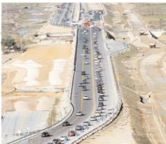
«Κυκλώματα φουσκώνουν τις τιμές αποζημίωσης ακινήτων»

Οι καθυστερήσεις στις απαλλοτριώσεις αποτελούν χρόνο «αγκάθι» των έργων, με καθυστερήσεις που ξεπερνούν τα δύο χρόνια. Χαρακτηριστική περίπτωση είναι οι πέντε υπό κατασκευή αυτοκινητόδρομοι. Με βάση τις συμβάσεις του 2007, οι απαλλοτριώσεις έπρεπε να συντελεστούν μέσα σε 12 μήνες, αλλά στα τέλη του 2009 ήταν μόλις στο 15%. Αποτέλεσμα; Οι εργαλάβοι δεκδικούν σήμερα από το Δημόσιο αποζημιώσεις της τάξης των 500 εκατ. ευρώ για καθυστερήσεις, μαζί με τις υποχρεώσεις του Δημοσίου για αρχειολογικές ανασκαφές και μεταπολίσεις των δικτύων κοινής ωφέλειας, που επίσης έ-