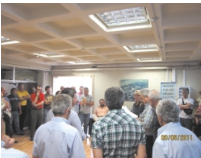
Από τη συμβολική κατάληψη του γραφείου του Περιφερειάρχη Δυτικής Ελλάδας

Όλοι οι Πολίτες τώρα γνωρίζουν πόσο τους στοιχίζουν η αποικιοκρατικού χαρακτήρα συμβάσεις παραχώρησης, ΣΔΙΤ, κλπ. Όλοι ξέρουμε πόσο κοστίζει η διέλευση της γέφυρας, πόσο κοστίζουν τα διόδια και πόσες δεκαετίες θα τα πληρώσουμε.