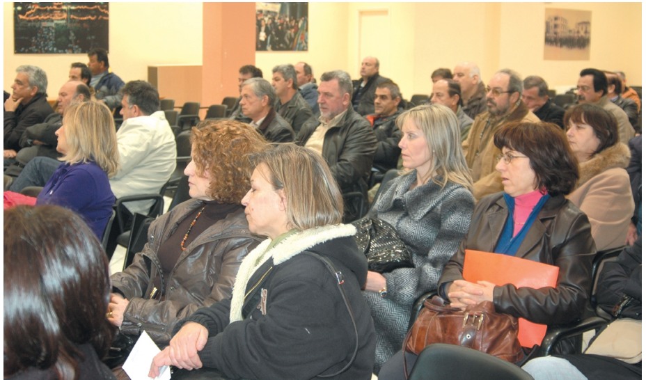
Από τη Γενική Συνέλευση του τοπικού συλλόγου στο Εργατικό Κέντρο Λαμίας

Συναδέλφισσες –οι, Η διοίκηση της Ομοσπονδίας, -και φαντάζομαι όλοι σας- με έκπληξη έμαθε, ότι στις 17/12/2010 η Κυβέρνηση με τον Ν. 3899/2010, «Επείγοντα μέτρα εφαρμογής του προγράμματος στήριξης της ελληνικής οικονομίας», αποφάσισε να «κλείσει» τη χρονιά προσφέροντας άλληλο ένα «δώρο» στους δημοσίους υπαλλήλους! Πιο συγκεκριμένα, έξι μήνες μετά την ψήφιση του Προγράμματος «Καθηλικράτης», αναίρει τις ίδιες τις αποφάσεις εμπαιζοντας και εξαπατώντας 50.000 περίπου υπαλλήλους ανά την επικράτεια, τους οποίους στο μεταξύ είχε κλείσει να κάνουν εθελοντικές μετατάξεις, αφού στο άρθρο 2 παρ. 22 του παραπάνω νόμου καταργεί τις διατάξεις των άρθρων 255, 256, 257 του «Καθηλικράτη», επανορίζοντας ότι όσοι μετατάσσονται δικαι-